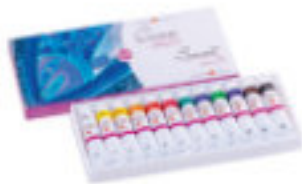
Studio Acryl-Set, 12x18 ml Tuben, Kartonbox