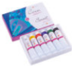
Studio Acryl-Set, 6x46 ml Tuben, Kartonbox