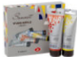
Studio Acryl-Set, 5x75 ml Tuben, Kartonbox