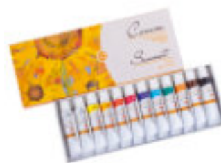
Studio Ölfarben-Set, 12x10 ml Tuben, Kartonbox