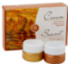
'Metallic' Studio Gouache-farben-Set, 6x20 ml