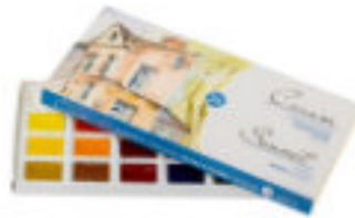
Studio Aquarellfarben-Set, 24 Farben in 2,5ml Näpfchen im Karton