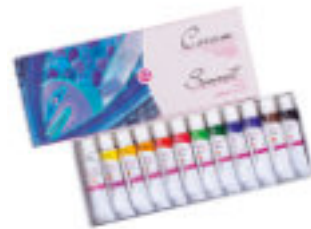
Studio Acryl-Set, 12x10 ml Tuben, Kartonbox