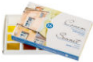
Studio Aquarellfarben-Set, 16 Farben in 2,5ml Näpfchen im Karton

Die Studio Aquarellfarben der Linie 'Sonnet' werden mit hochwertigen Pigmenten und Bindemitteln hergestellt, die die Hauptmerkmale von Aquarellfarben gewährleisten: Transparenz, Intensität, Farbreinheit. Sie sind perfekt vermischbar, wasserlöslich und lassen sich leicht auftragen.