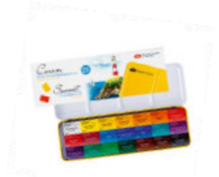
Studio Aquarellfarben-Set, 21 Farben in 2,5ml Näpfchen im Metallkasten