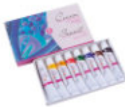
Studio Acryl-Set, 8x10 ml Tuben, Kartonbox