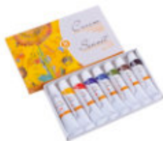
Studio Ölfarben-Set, 8x10 ml Tuben, Kartonbox