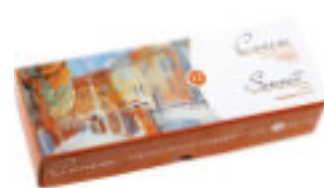
Studio Gouachefarben-Set, 12x40 ml